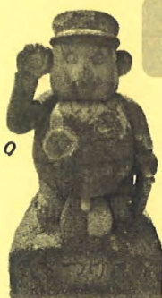
来待駅の 駅長たぬき

日本初の鉄道は1872(明治5)年 10月14日、新橋-横次間で開業。 今年、鉄道開業150周年です。