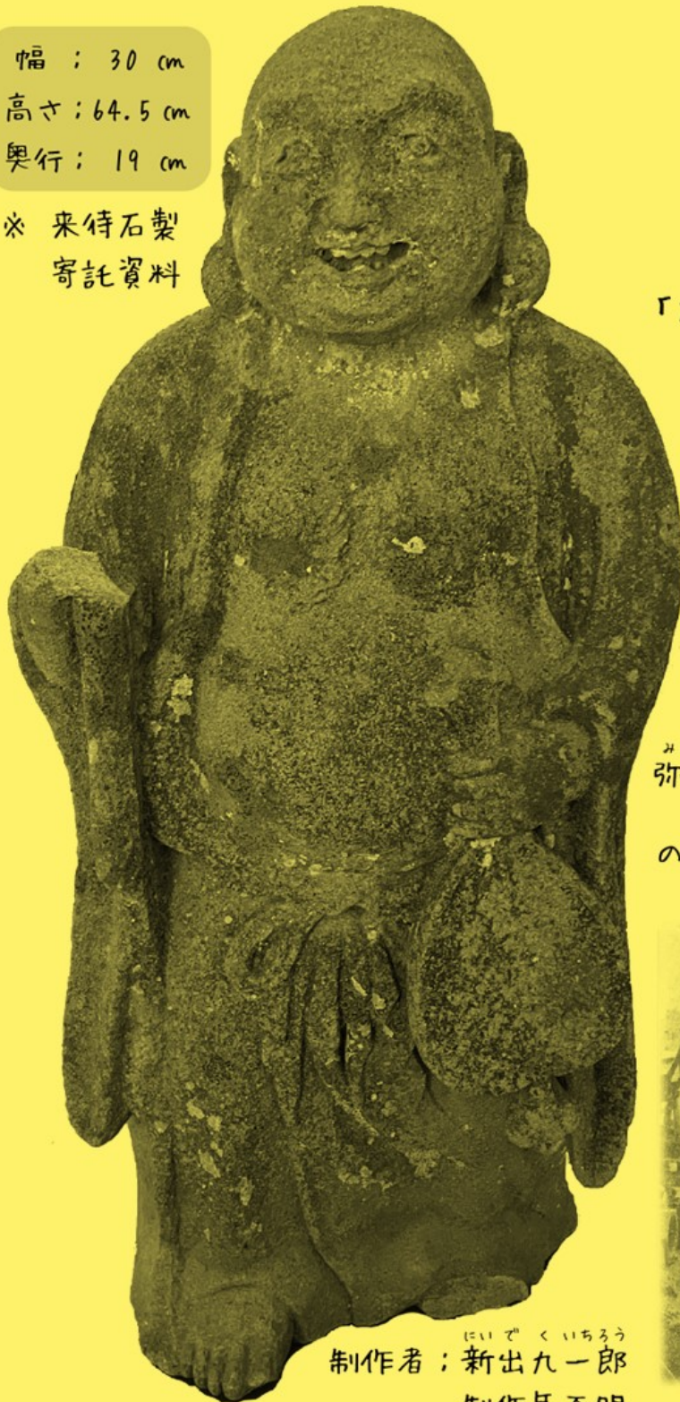
制作者 : 新出九一郎 制作年不明