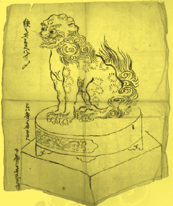
縦43 cm × 横35.5 cm