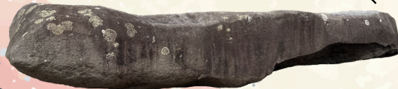
大庭の音石 松江大橋南詰・源助公園内（松江市白鷺本町）