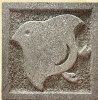
(20 cm × 20 cm)

受付時間… 9:00～12:00 13:00～16:00 体験時間… 約1時間30分 料金… 一般2,630円 小中学生1,740円