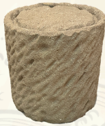
如泥石（宍道湖の波止石）1/3模型 来待石製 製作・所蔵：来待石灯ろう協同組合