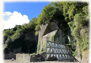
石切場跡の博物館

〒699-0404 島根県松江市宍道町東来待1574-1 TEL 0852-66-9050 / FAX 0852-66-1430 WEB https://www.kimachistone.com