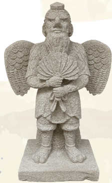
天狗像：寄託資料 来待石製 製作：坪内正史氏